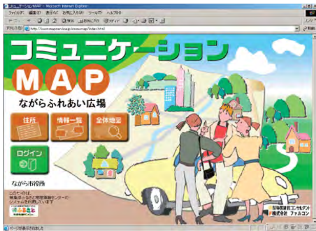
システム立ち上げ画面