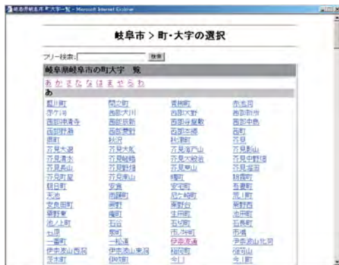
町丁目検索表示例