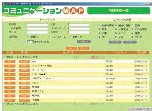
情報一覧検索表示例