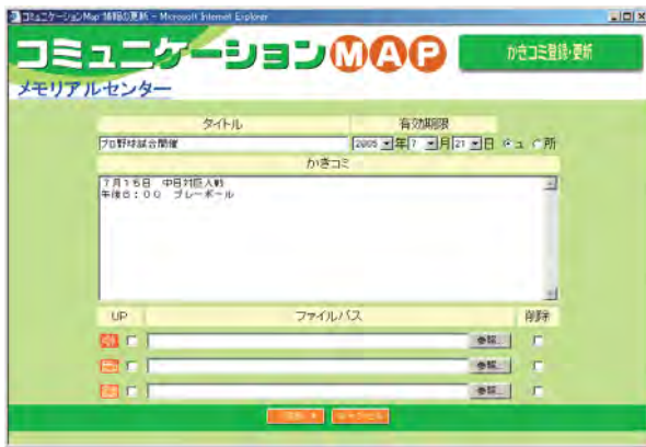
情報かきこみ登録表示例