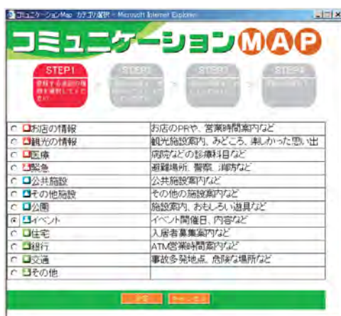
かきこみ対象項目表示例